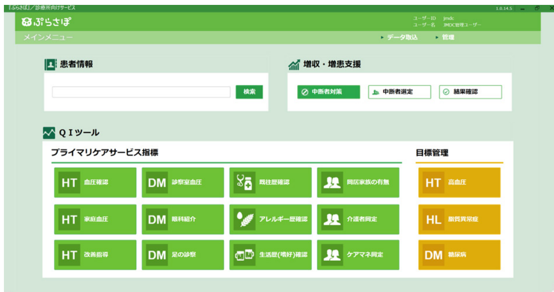
「ぷらさぼ®」の画面イメージ

JMDC はクリニック向けに、院内データを集計して Quality Indicator (診療の質指標) を作成するアプリケーション「ぷらさぼ®」を 2018 年 4 月より提供しています。今まで可視化されていなかった自院の診療実態を把握することができます。また、治療を中断した生活習慣病患者への通知作成機能が搭載されており、クリニックから患者へ受診を促すことが可能です。ぷらさぼ®はプライマリ・ケア医が患者へ質の高い診療を提供できるようサポートいたします。